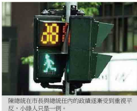
陳總統在市長與總統任內的政績逐漸受到重視平反，小綠人只是一例。