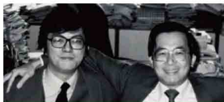
Nylon 27 鄭南榕 殉道27年 1947-1989