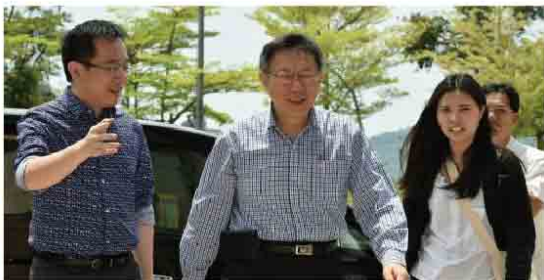
柯P今年第二次來關心阿扁，上次是挑戰單車一日雙塔後隔天一早，醫者父母心，實令人感動。