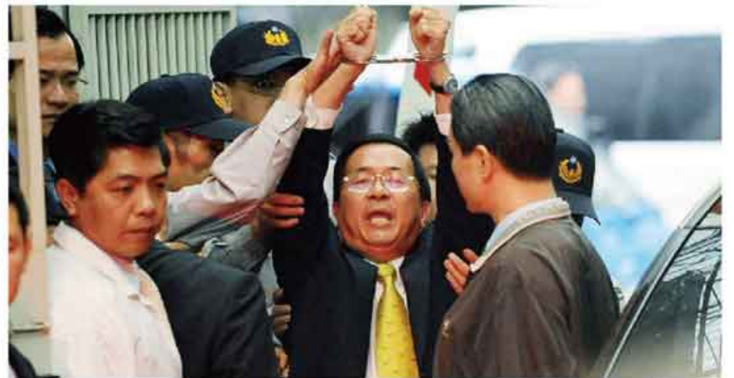
前副總統呂秀蓮表示：扁案、核四背後都有惡勢力。保外就醫、停建核四這兩件事都是關係到台灣公平與正義的問題，也都是民意多數贊成，但馬政府卻一意孤行、蠻橫反對，到底是什麼惡勢力在背後？