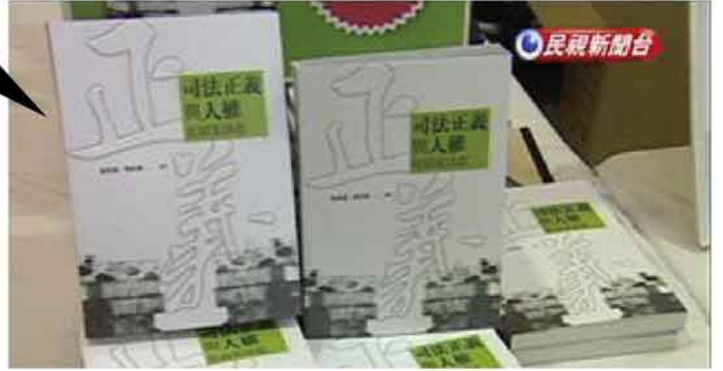
第一次，法律界菁英站出來，告訴您為何「扁案是政治迫害」，書名：司法正義與人權 - 從扁案談起，由前國史館館長張炎憲主編，邀請八位學者專家、律師從不同角度執筆，論述扁案是司法「政治工具化」的產物，扁案不是個案而已，這是台灣司法整體的腐敗墮落，每一個人民都可能是潛在的、下一個受害者。

這本書絕對會在扁案平反的歷史上留下非常有意義的一筆，有興趣的朋友，可用【捐款贈閱】方式，聯絡專線 02-3322-3818