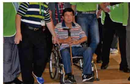
阿扁總統的手不自主顫抖，是一直存在的大腦退化病變造成的各種症狀之一，右手因為持續不自主抖動，所以下意識會以左手壓住右手，這些在醫療報告都有記載，才不是「看到鏡頭才抖手」。