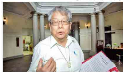
監委陳師孟強調重查馬案重要性。