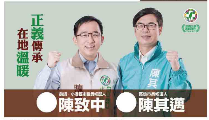
正義傳承！在地溫暖！高雄市長候選人陳致中與未來陳其邁市長拍攝宣傳合照。