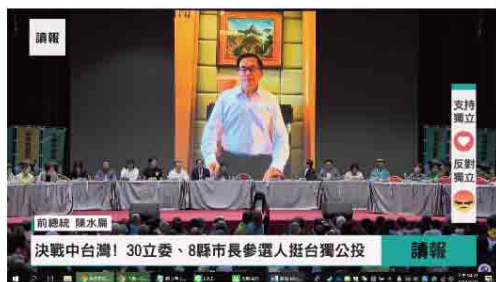
喜樂島聯盟召集人大會 今日下午於台中中小巨蛋舉行，無法出席的前總統陳水扁也透過預錄影影片的方式致詞表達支持。