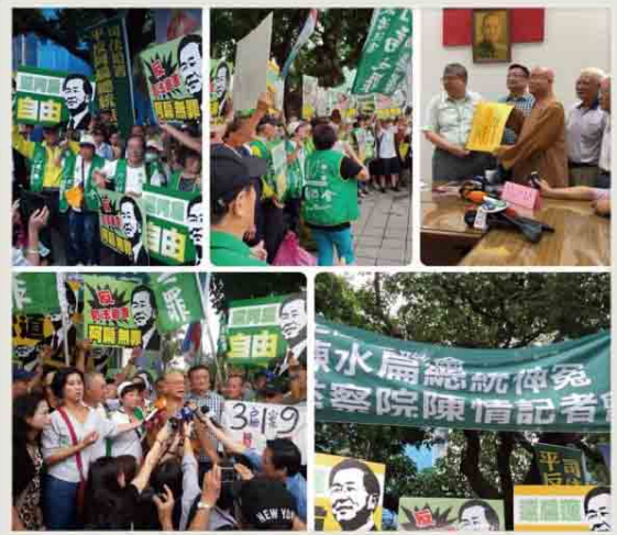
扁聯會昨向監委陳師孟陳情，要求特赦阿扁。