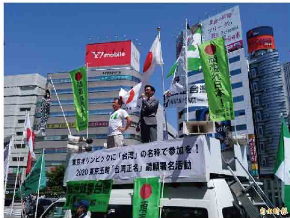
日民間團體支持台灣用「TAIWAN」名義參加東京奧運。 (資料照)