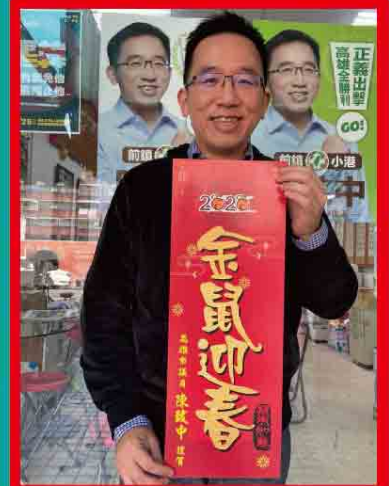
2020 金鼠迎春 X 致中版春聯 蓬萊島雜誌Formosa感恩您的支持 祝福大家都有鼠不盡的快樂、幸福!