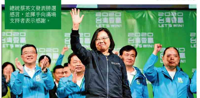
總統蔡英文發表勝選感言，並揮手向滿場支持者表示感謝。