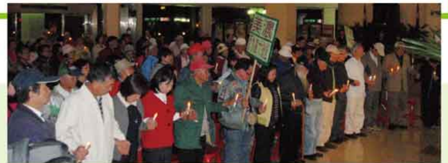
感恩陳總統燭光祈福晚會 (榮總大廳) 2012.12.22