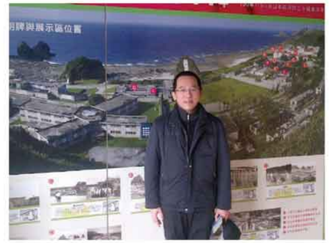
關不住的聲音 - 我在陳總統一手成立的綠島人權園區聲援完全沒有人權的陳總統！