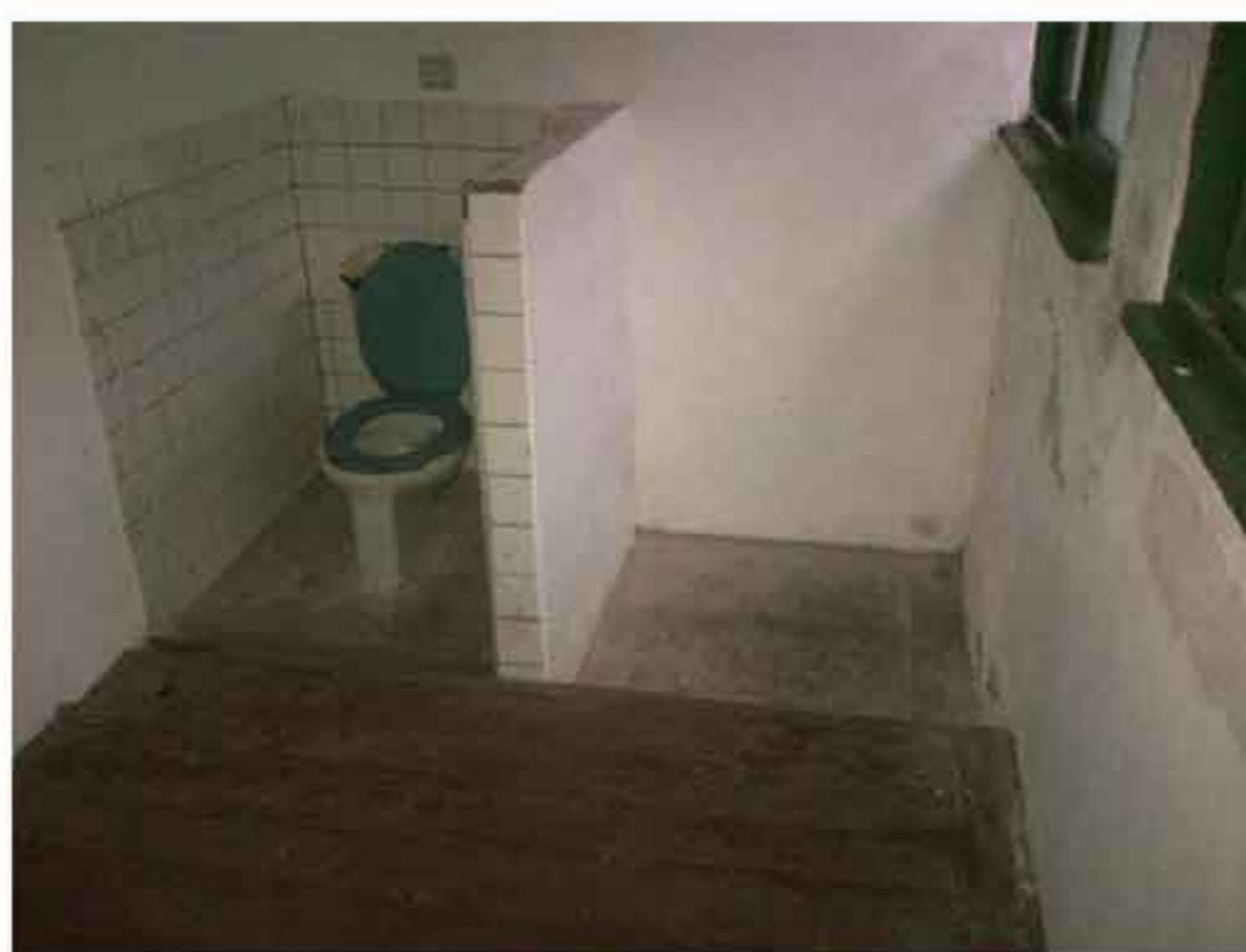
白色恐怖時期「國防部綠島感訓監獄」(綠洲山莊)的獨居房實景，廁所置有坐式馬桶以及遮蔽的矮牆。

綠島人權紀念碑的題字「在那個時代，有多少母親，為她們囚禁在這個島上的孩子，長夜哭泣。」(柏楊)解嚴之後，政治犯本應該從台灣的監獄消失絕跡，阿扁總統卸任後卻因政治關入黑牢迄今超過四年，即使重症纏身、生命堪憂，亦無法保外就醫，天公伯垂憐，我們還要讓年邁的扁媽在長夜中哭泣多久？