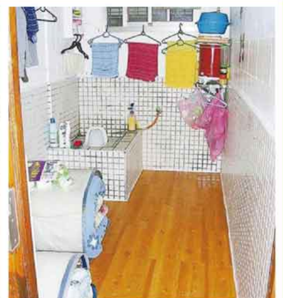
阿扁總統在北監1.38坪的黑牢(住兩人)比過去綠島軍事監獄的牢房更加狹小(如左圖所示)。