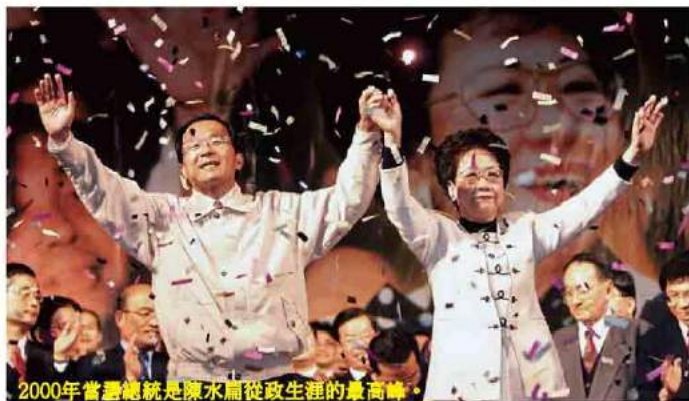
2000年當選總統是陳水扁從政生涯的最高峰。

陳水扁在2000年就職演說時，提出了令獨派驚駭的「四不一沒有」的主張：「如果中共無意動武，則本人保證在任期之內，不會宣布獨立，不會更改