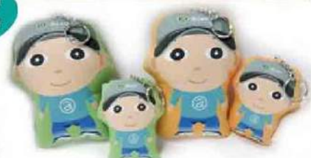
贈送限量阿扁娃娃珍藏版鑰匙圈吊飾

2017年5月19日 (週五) 晚上6:30入席 典華飯店-大直旗艦會館 六樓花田盛事廳 (台北市中山區植福路8號) 1. 餐券每張NT$5,000元，認購一桌NT$50,000元；如未能出席可純贊助餐會，金額不拘，餐券則委由基金會處理。 2. 認購餐券或贊助之金額可由基金會開立正式捐款收據，依法供抵稅用途。