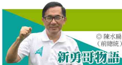
◎ 陳水扁 (前總統)