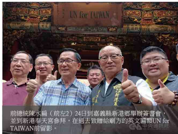
前總統陳水扁（前左2）24日到嘉義縣新港鄉舉辦簽書會，並到新港奉天宮參拜，在過去致贈給廟方的英文匾額UN for TAIWAN前留影。