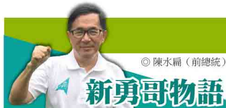
◎ 陳水扁 (前總統)